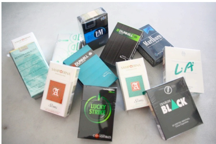
Figura: Embalagens de cigarros com aditivos