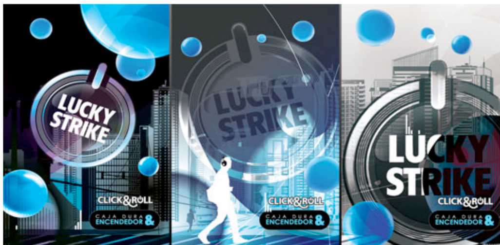
Figura: Embalagem de cigarro: basta um click para liberar o sabor