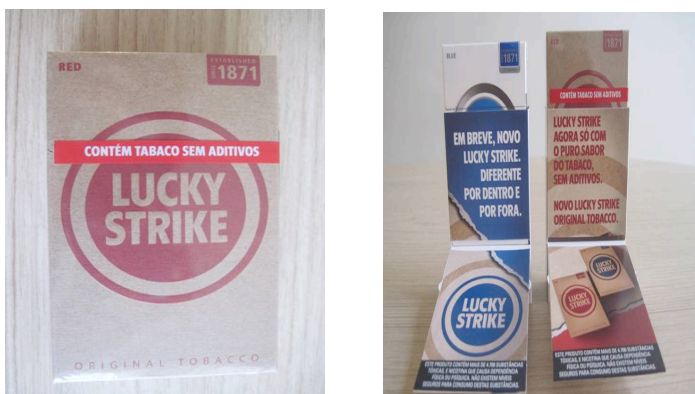
Figura: Cigarro sem aditivos