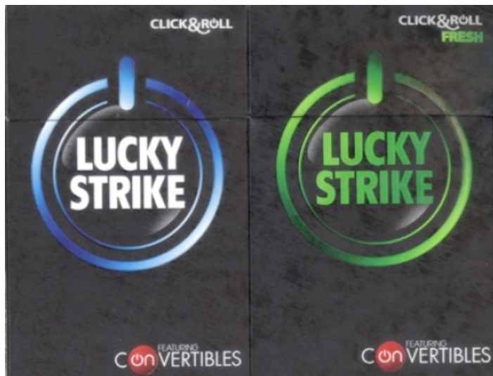
Figura: Embalagem de cigarro com aditivo “click to change the taste”

havia experimentado cigarros. A dependência os mantém fumando durante a vida adulta, expostos aos riscos e danos provocados pelo tabagismo.